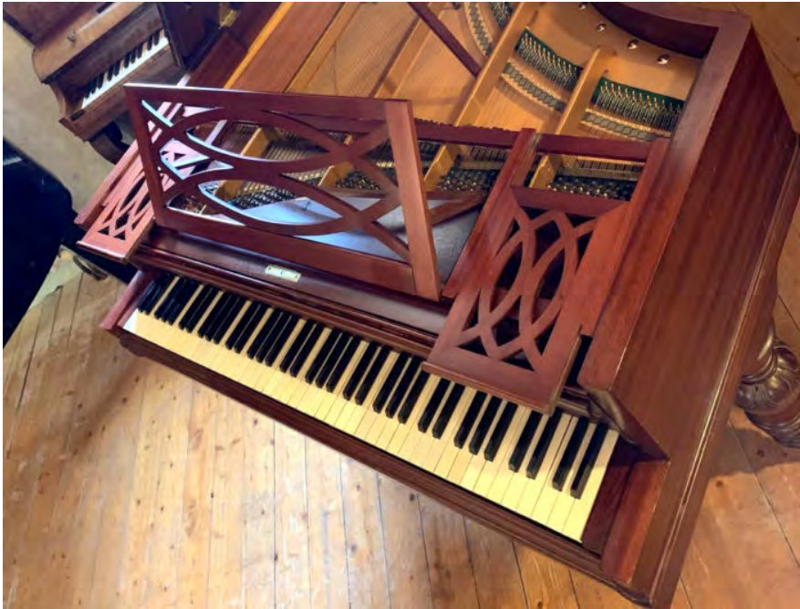
Piano Pleyel 204cm

Les deux pianos utilisés pour le concert à Odysud datent de la deuxième moitié du XIXe siècle et ont été joués par Chopin pour l'un et Liszt pour l'autre. Ils ont respectivement été retrouvés dans un hangar et dans une brocante, il fallut beaucoup de patience et de savoir-faire à Gérard Fauvin pour les restaurer !