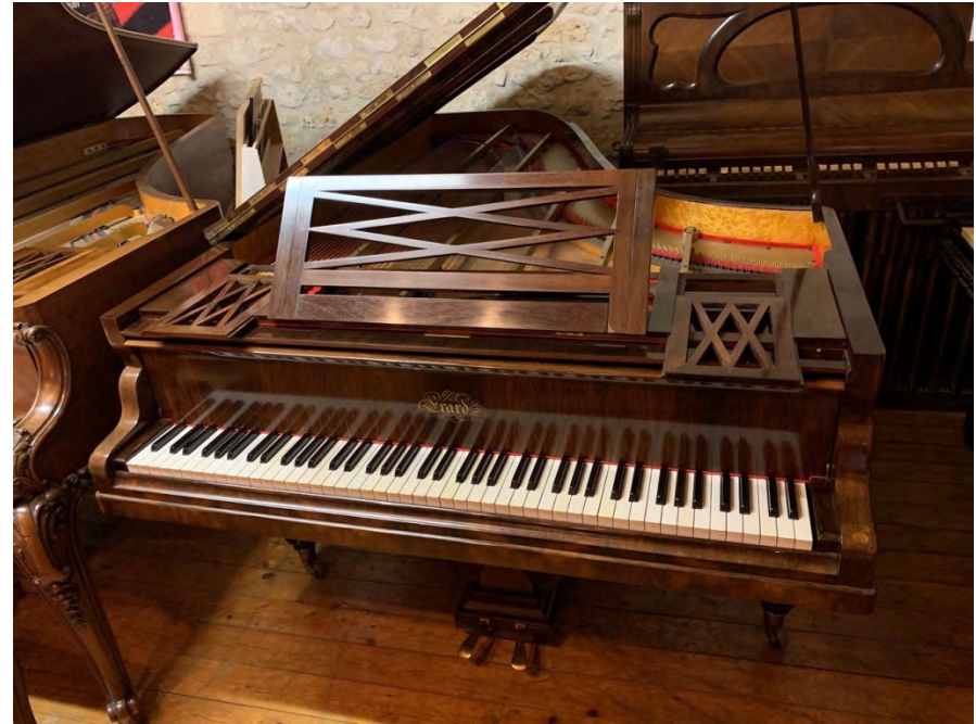
Piano Erard 212cm