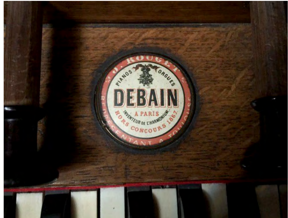
Harmonium réalisé dans les ateliers Debain probablement à la fin du XIXe siècle.