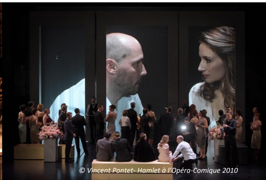
Hamlet à l'Opéra-Comique 2010