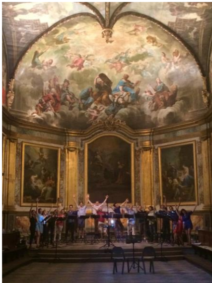
Chapelle des Carmélites- Toulouse

🎵 Des extraits du disque sont aussi disponibles sur Souncloud !