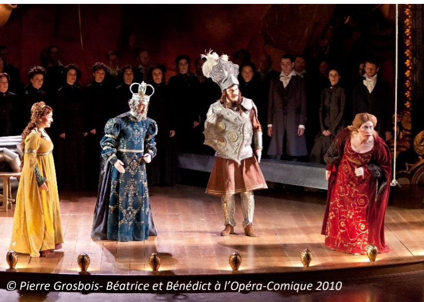
Béatrice et Bénédict à l'Opéra-Comique 2010

Depuis maintenant 20 ans le chœur de chambre des éléments incarne les chœurs d'opéras dans différents spectacles. Des opéras baroques du XVIIe, aux créations contemporaines en passant les opéras de Mozart ou les opéras romantiques, les éléments ont exploré toutes les périodes de l'opéra !