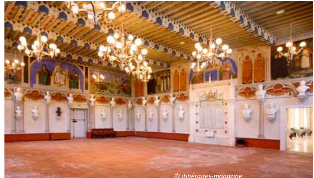
Salle des Illustres- Abbaye école de Sorèze