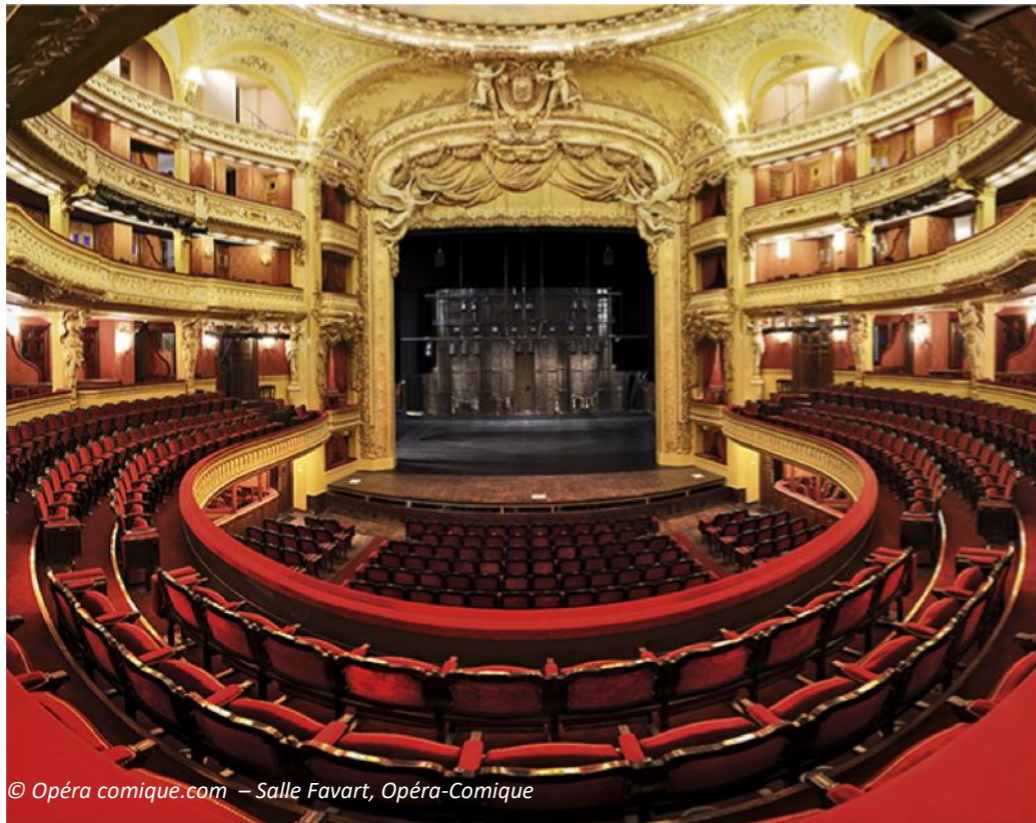
Salle Favart, Opéra-Comique

Chaque hiver depuis dix ans, les éléments sont invités pour une production à l'Opéra Comique. L'Opéra Comique est construit à la fin du XVIIIe siècle sous le règne de Louis XVI. Cette salle de spectacle également surnommée « Salle Favart » en hommage au célèbre librettiste* Charles-Simon Favart se trouve à Paris, dans le deuxième arrondissement. Son nom « Opéra Comique » fait aussi référence à un genre musical qui se distingue de l'opéra car il contient des passages parlés contrairement à l'opéra qui est entièrement chanté. Le sujet n'est donc pas toujours drôle et le public n'est pas obligé de rire !