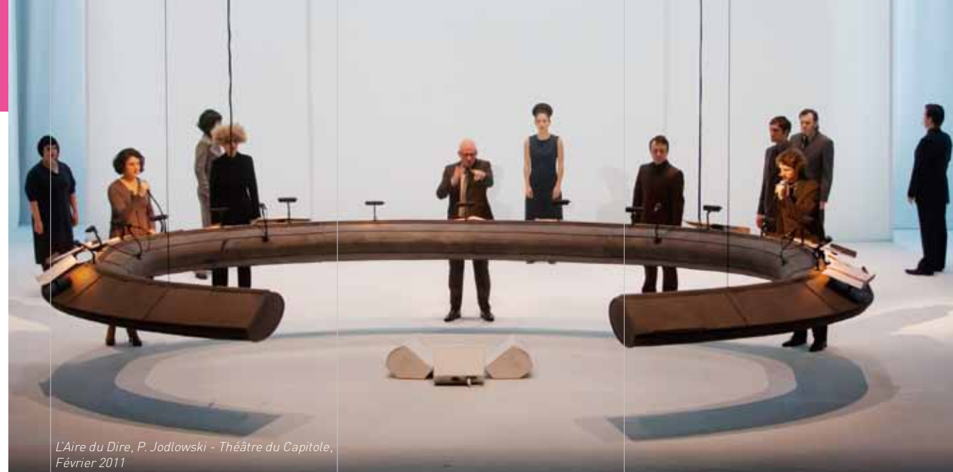
L'Aire du Dire, P. Jodlowski - Théâtre du Capitole, Février 2011

Avec chacun d'entre eux, le chœur a su développer des relations particulières et des affinités électives, sources d'émotions souvent intenses.