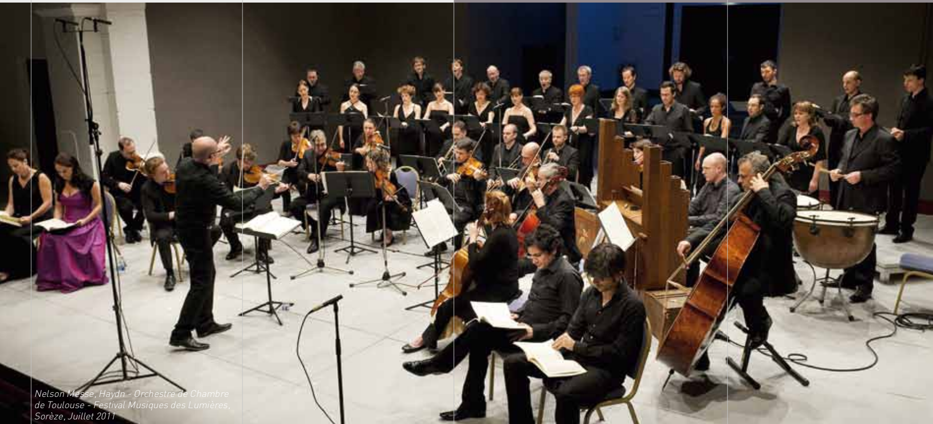
Nelson Messe, Haydn - Orchestre de Chambre de Toulouse - Festival Musiques des Lumières, Sorèze, Juillet 2011