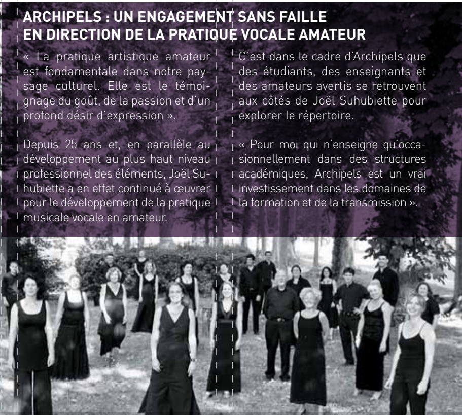
Archipels, Académie d'été - Abbaye-Ecole de Sorèze, Juillet 2010