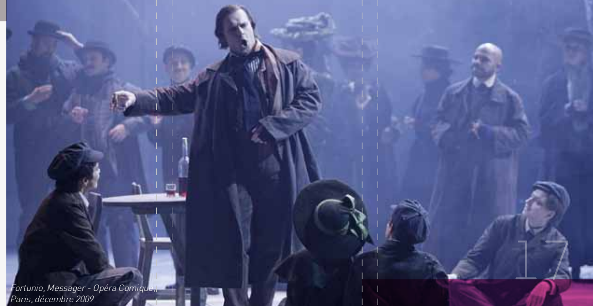
Fortunio, Messenger - Opéra Comique, Paris, décembre 2009