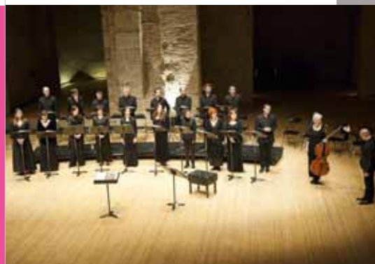
Musique anglaise du XX ème siècle - Auditorium Saint-Pierre des Cuisines, Toulouse, Février 2012