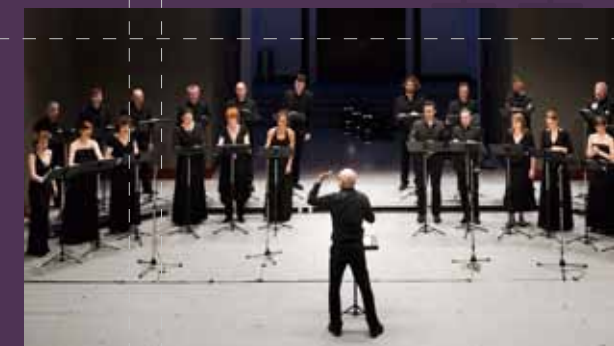
Messe, Frank Martin - Festival Musiques des Lumières - Sorèze, Juillet 2011