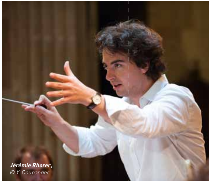
Jérémie Rhorer