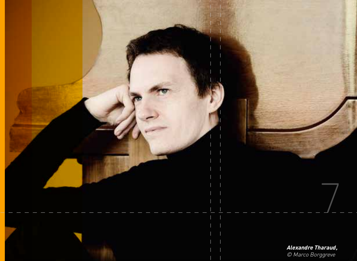
Alexandre Tharaud

Samedi 27 juillet 2013 à 21h - Eglise Notre Dame d'Assomption de Lambesc (13) Renseignements et réservations : Festival de la Roque d'Anthéron : 04 42 50 51 15 www.festival-piano.com