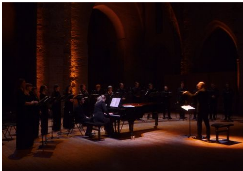
Le chœur, la pianiste et le chef dans l'ombre de la séquence "Abendlied"

Mêlant pièces pour chœur a cappella, pour chœur et piano, pour piano seul, ce programme brosse le portrait attachant d'un période en mutation profonde. L'atmosphère particulière de cette soirée, une atmosphère magique de recueillement, s'accompagne d'une recherche adaptée sur la lumière qui éclaire les chanteurs, la pianiste et le chef. La parfaite structuration de ce programme, la succession élaborée des tonalités et des évocations construisent une sorte de voyage symbole dans le temps : du soir au matin, puis du matin au soir : « le crépuscule, l'aube... l'automne, le printemps... la mort, la vie... »